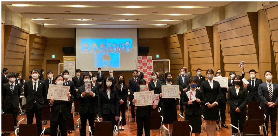
インターカレッジ・コンペティション 2020 表彰会場（2020年12月16日開催）